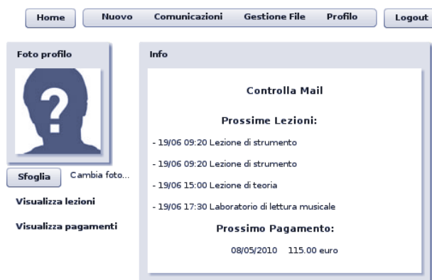
Pagina principale allievo: consente di gestire facilmente tutte le informazioni legate alla propria attività accademica.

L'allievo dalla propria pagina personale avrà modo di visualizzare le date e gli orari delle prossime lezioni, i prossimi pagamenti da effettuare, le valutazioni - se disponibili - sulla propria attività didattica, comunicare con gli altri allievi attraverso un semplice sistema di chat, avere visione di tutto il proprio calendario delle lezioni e accesso al materiale didattico condiviso dagli insegnanti.